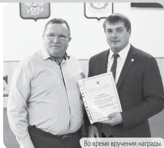
Во время вручения награды.

По информации филиала ФГБУ «Россельхозцентр» по СК, фото ФГБУ.